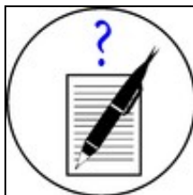
Hinweise für Autoren